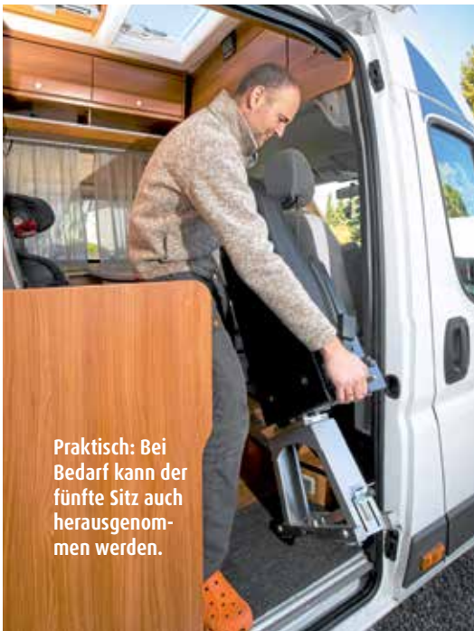
Praktisch: Bei Bedarf kann der fünfte Sitz auch herausgenommen werden.

Mehr Passagiere als Sitzplätze – was nun? Wenn das Reisemobil nicht genügend Sitzplätze hat, sind GURTE UND SITZE ZUM NACHRÜSTEN die Lösung.