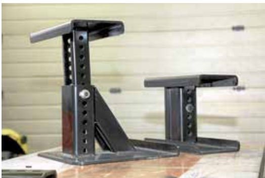
Diese Distanzböcke können die Höhe eines Doppelbodens überbrücken.