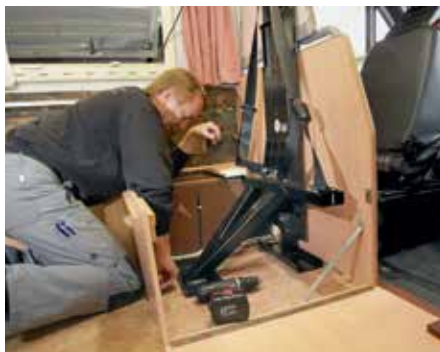
Dauerhafte Lösung: Hier wird die Dinettenbank zu zwei Sitzen entgegen der Fahrtrichtung.

ab, ob man selbst Hand mit anlegt oder die Montage komplett den Profis überlässt. Ein Gurtbock samt Verankerung schlägt mit etwa 500 bis 800 Euro zu Buche. Die Montage kostet je nach Aufwand ab 350 Euro, kann aber auch ins Vierstellige gehen. Wer die anfallenden Schreiner- und Polsterarbeiten machen lässt, muss mit weiteren 2500 Euro rechnen. Hinzu kommen noch die Abnahme durch den TÜV sowie der Eintrag in die Fahrzeugpapiere. Neben dem Preis sollte man sich auch über das zusätzliche Gewicht klar sein, das mit einem neuen Sitz mit auf die Waage kommt. Ein durchschnittliches Rückhaltesystem wiegt etwa 30 Kilogramm.