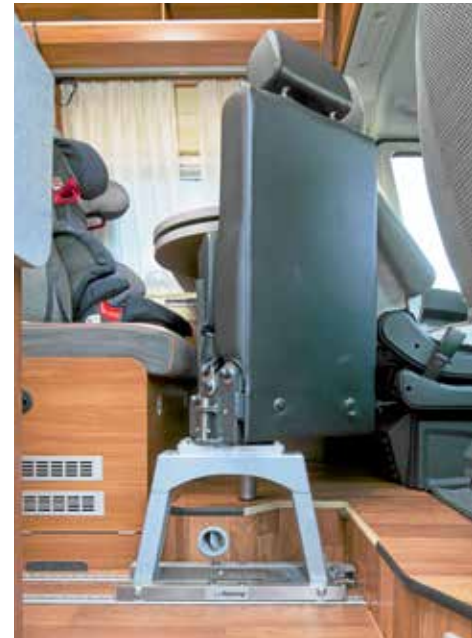
Platz ist in der kleinsten Hütte: In diesem Globecar Revolution wurde ein fünfter Sitzplatz nachgerüstet.